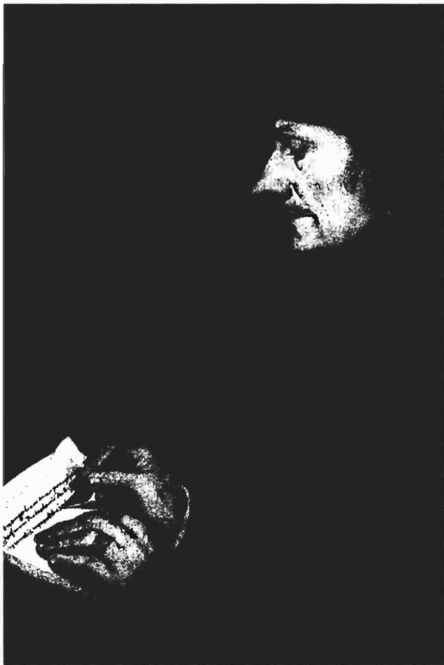
Detalhe do retrato de Erasmo de Rotterdam, pintado por Hans Holbein, em 1523. A pintura tem (36,8 x 30,5) cm e pertence à coleção do Kunstmuseum, Öffentliche Kunstsammlung, de Basileia.